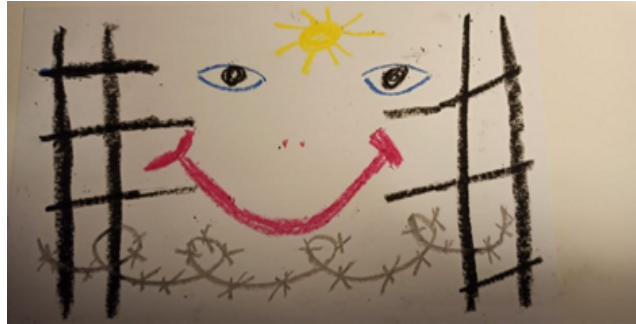
תמונה 11: אוליבר