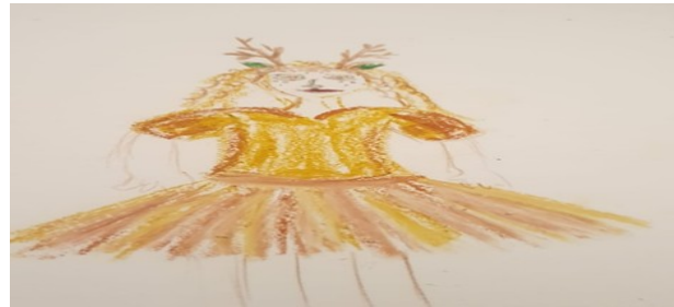
תמונה 9: מולי