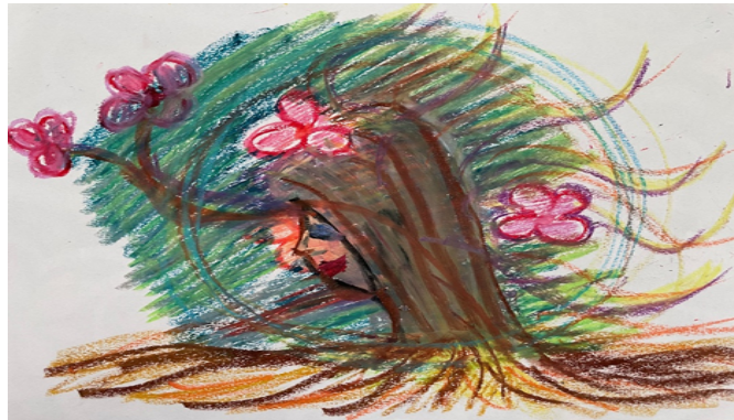
תמונה 13: תגובת החוקרת ליצירתם של המשתתפים

כאשר עובדים עם ילדים המאובחנים בא"ס, ניתן להרגיש חסרי מילים. האומנות סייעה לי לחקור לעומק את חוויותיהם ואת תחושותיהם של המשתתפים במחקר זה. האפלה אט-אט התפוגגה והידע עזר לי להאיר בזרקור ולגרש את החושך. בתמונה 13 מוצגת יצירה שציירתי בעקבות השתתפותי במחקר זה. התמונה מסמלת את התהליך שעברתי כחוקרת. ישנה חשיבות מכרעת לכך שאנשי מקצוע מתחום הטיפול באומנות ילמדו כיצד לעבוד עם א"ס, מאחר שלאומנות תפקיד מרכזי בהפחתת חרדה ויצירת תקשורת בלתי מילולית.