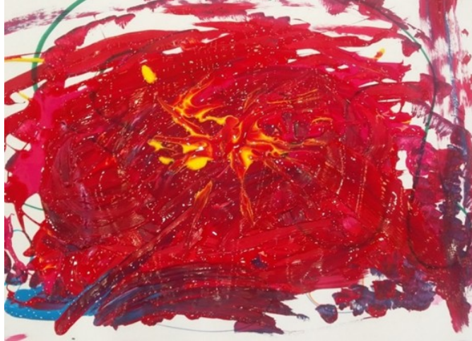
תמונה 1: האומן הפצוע

וכואב מאחר שהוא מתאר את הקושי הרגשי שלי כילדה לשוחח, הוא מתאר מאבק פנימי להצליח לדבר.