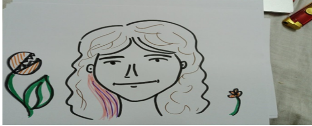
תמונה 8: ברית