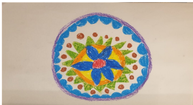
תמונה 4: מישל