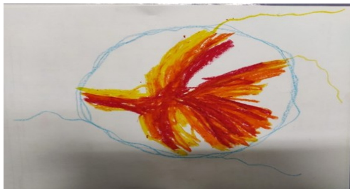
תמונה 6: מדלין