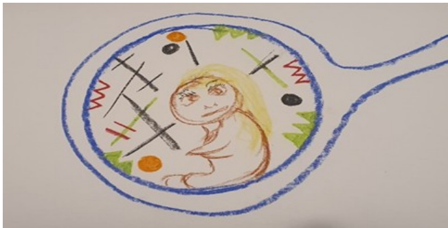
תמונה 3: קלייר

למטופלת שלה, אשר לוחשת בפגישותיהן. המעגל הכחול בציור ייצג את הקול של המטופלת אשר אותו מדלין לא הצליחה לשמוע (תמונה 6).