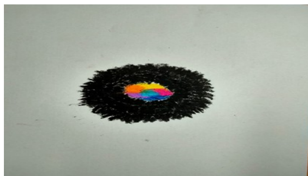
תמונה 5: מגי